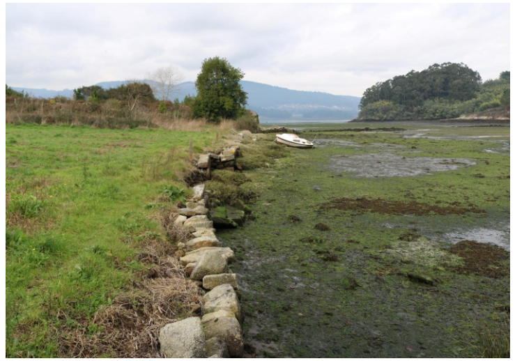
Punta Pesqueira e enseada de Soutoxusto

Comezamos baixando á enseada de Soutoxusto para rodear a punta Pesqueira e chegar á praia de Soutoxusto , pasar dela a punta de Fontán e logo, por pequenas manchas de area e beiradas de pedras, á punta Sobreira e a Cova do Asno desde onde se pode pasar á praia do Cabo , e seguir, se aínda da o tempo, para rodear a Punta , percorrer as praias de Cesantes e O Castañal ata chegar ao porto de Cesantes . Do porto de Cesantes en diante temos a punta da Canteira que non se pode rodear porque non hai camiño doado nin terreo que o permita, polo que seguindo a estrada cara a Redondela chegamos ao rego do Pexegueiro onde temos un paseo acondicionado que rodea a punta Mouríño e continúa pola beira do esteiro do río Alvedosa , apegado á liña da costa, ata a Portela . Na Portela remata a posibilidade de camiñar seguindo a costa porque outra vez as vías do tren volven a ir moi preto do mar e non hai camiños que a sigan ademais comezan a aparecer espazos ocupados por recheos e instalacións industriais polo que xa só podemos facer visitas puntuais a Rande e a Chapela .