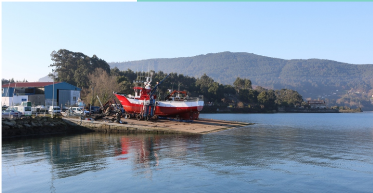
Porto de Cesantes