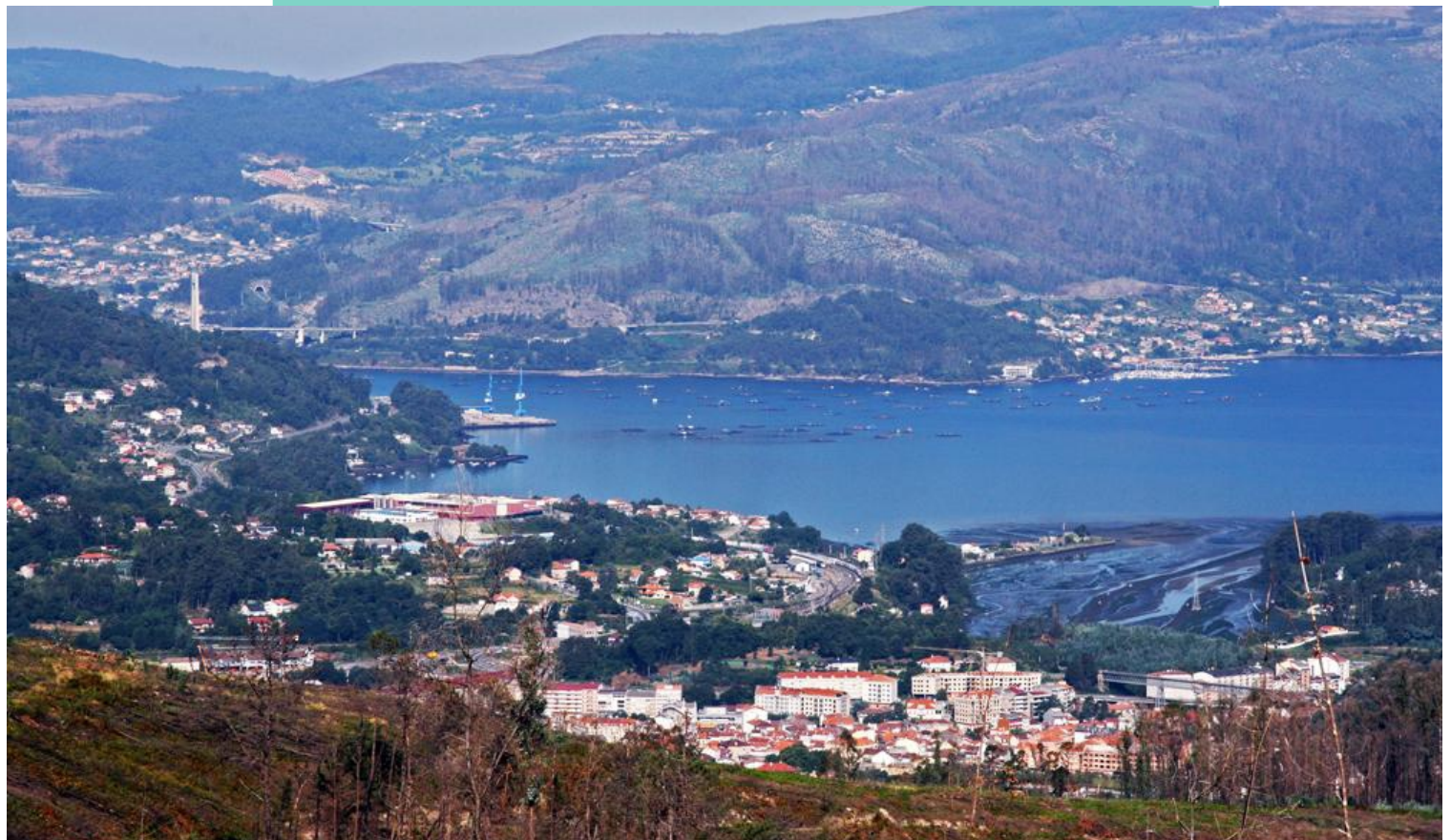
-REDONDELA. Esteiro do Alvedosa. Vista desde o Galleiro.