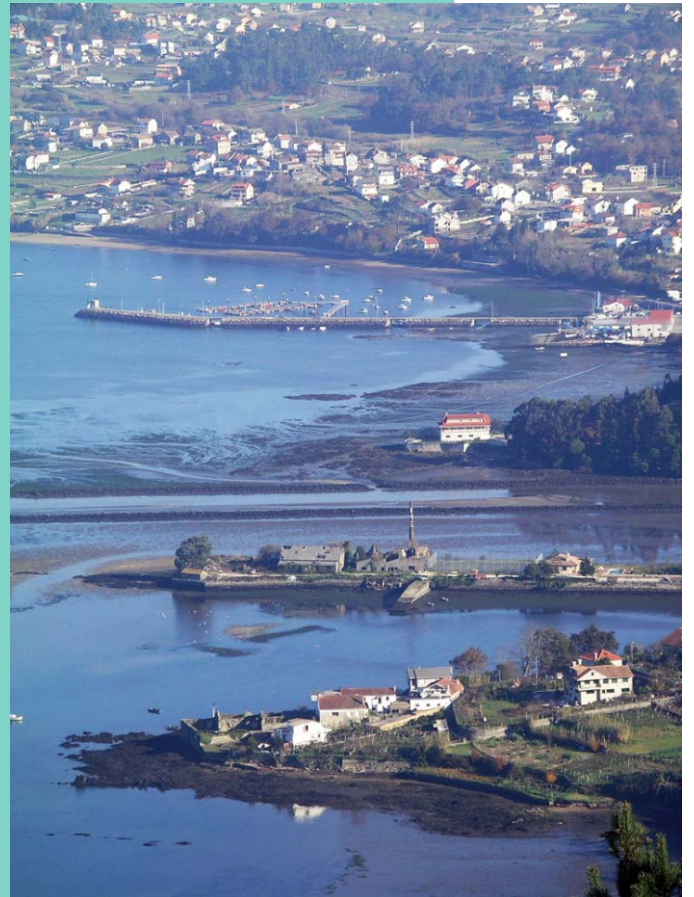
A Portela, O Socorro, A Canteira e o Porto de Cesantes