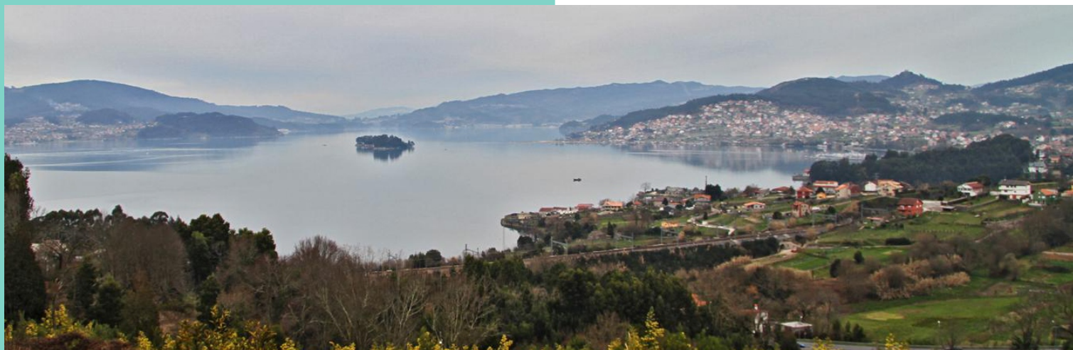
Vista de Redondela e a enseada de San Simón desde Cedeira

Coa marea baixa é posible camiñar entre Soutoxusto e Cesantes por unha sucesión de puntas e pequenos areais que deixan espazo para andar.