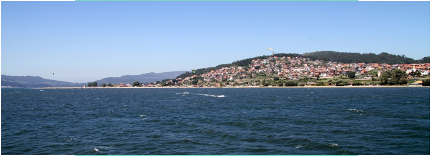
Praias de Cesantes e do Castañal