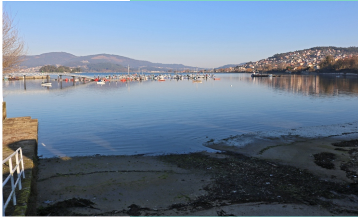
Praia do Castañal e porto de Cesantes