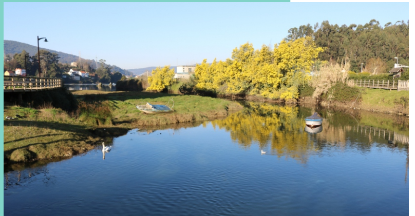
O río Alvedosa nace ao norte da serra do Galleiro e despois de percorrer 9 km polos concellos de Pazos de Borbén e Redondela, desauga na enseada de San Simón, na ría de Vigo.