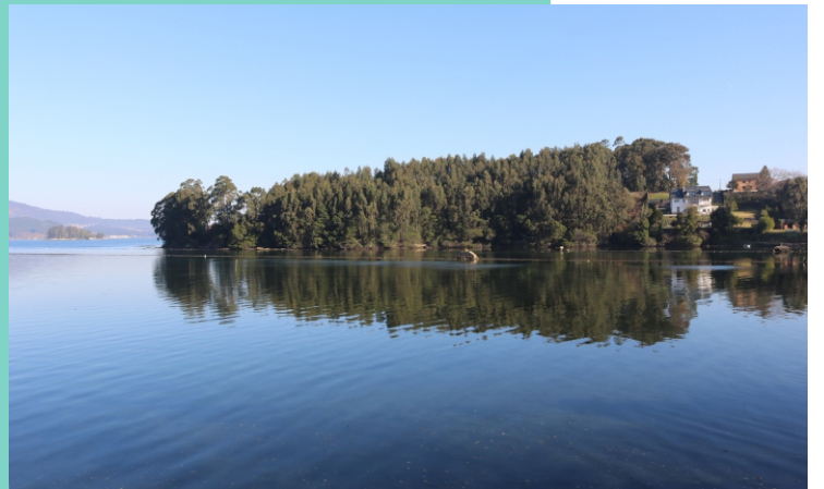
Punta da Canteira