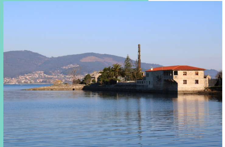
Punta do Socorro