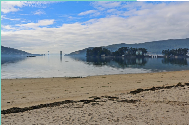
Praia de Cesantes. Un acolledor areal de 2.400 m de lonxitude que se sitúa aos dous lados dunha frecha areosa.