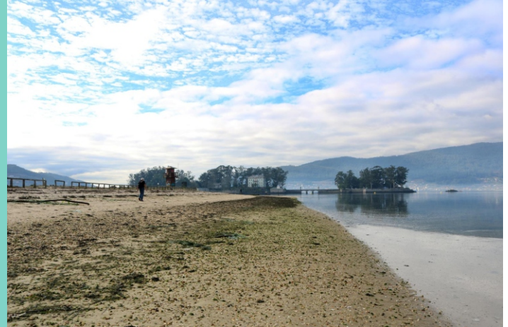
Praia e punta do Cabo (Cesantes) e illas de San Simón.

As Illas de San Simón e San Antón, xunto cos illotes San Bartolomeu e San Norberto forman un pequeno arquipélago situado fronte á praia de Cesantes. Para visitalas é preciso dispor de transporte (hai empresas que organizan viaxes guiados) e solicitar un permiso á Xunta de Galiza.