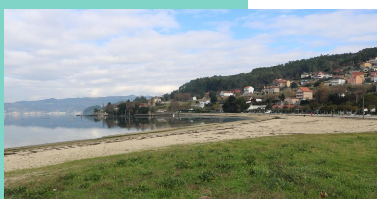
Praia e punta do Cabo (Cesantes)