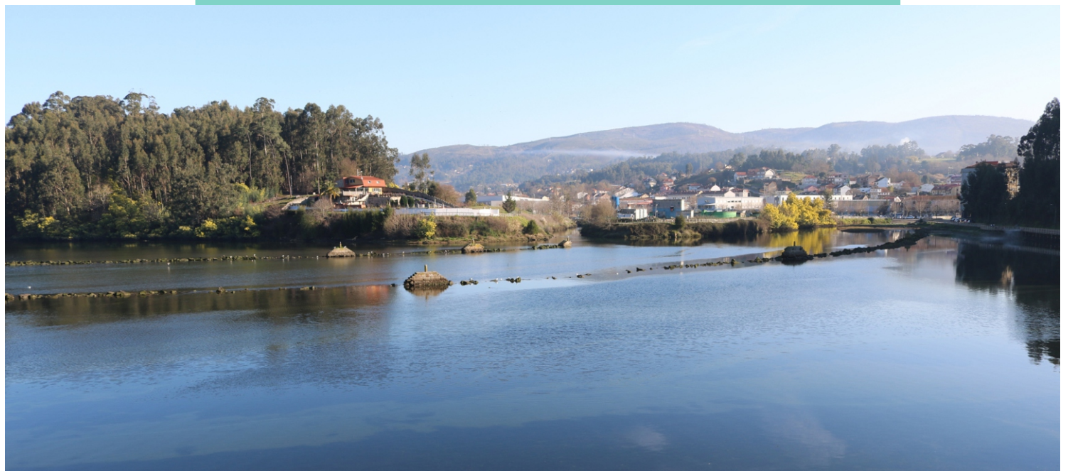
Desembocadura dos ríos Alvedosa e Pexegueiro