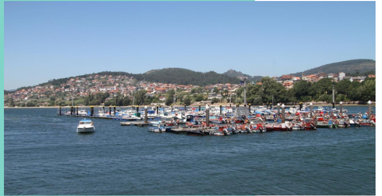
Porto de Cesantes