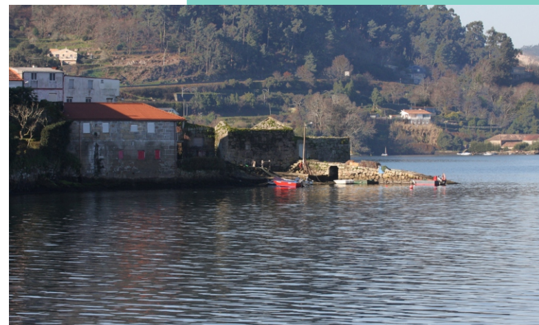
Punta da Portela