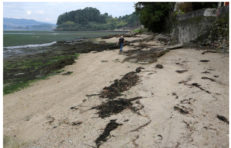
Enseada e praias de Soutoxusto